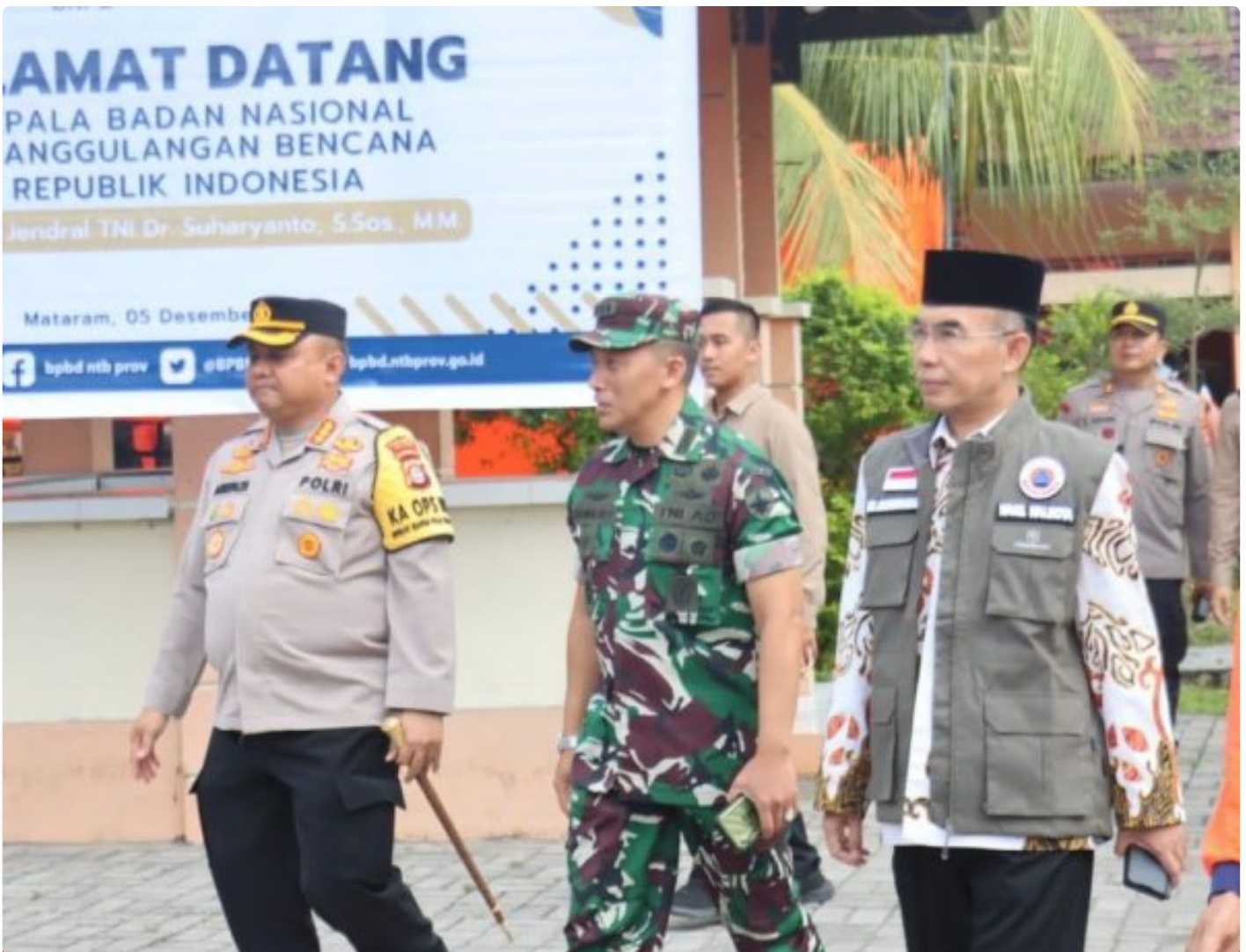
Kapolresta Mataram (Kiri) saat menghadiri acara Peletakan batu Pertama pembangunan gedung Pusdalops BPBD NTB, Kamis (05/12/2024)